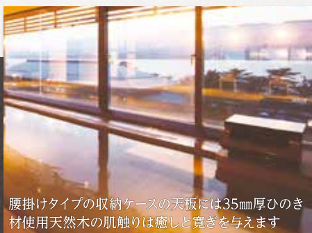
腰掛けタイプの収納ケースの天板には35mm厚ひのき材使用天然木の肌触りは癒しと寛ぎを与えます

効果効能の表記ができるため老若男女問わず、あらゆるニーズにあわせ、大手ホテルチェーン、旅館、健康福祉センター、老人福祉設、スポーツセンターなど、全国約1000カ所を上回る幅広い施設で活躍しています。浴槽にあわせた収納ケースを設置するだけの大規模な工事の必要が無いため低コストで今すぐ導入が可能です。光明神温泉は光明石製造所の登録商標です。