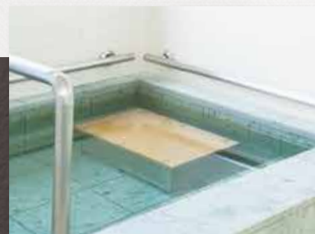
サービス付き高齢者住宅 みやびの森