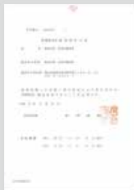
▲ 医薬部外品製造業許可証