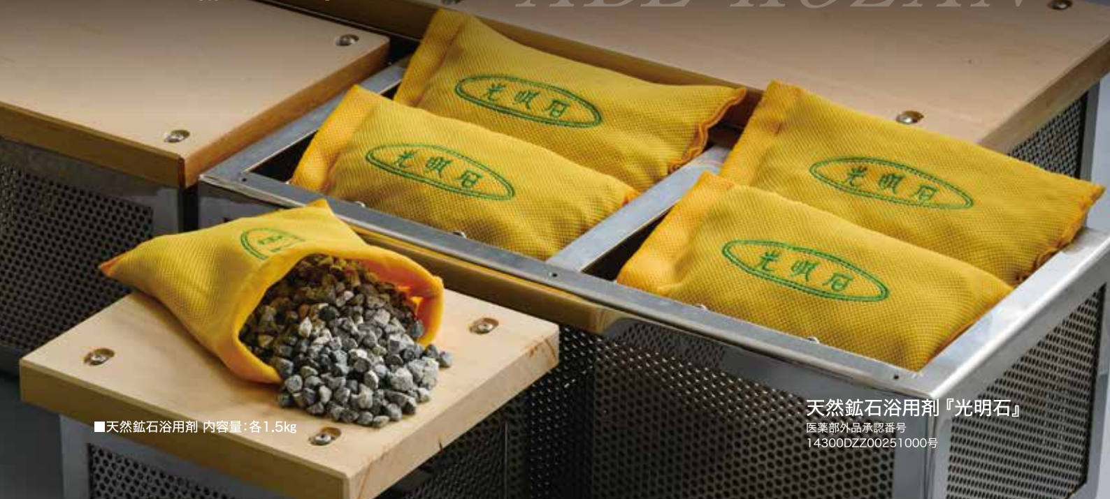
■天然鉱石浴用剤 内容量：各1.5kg